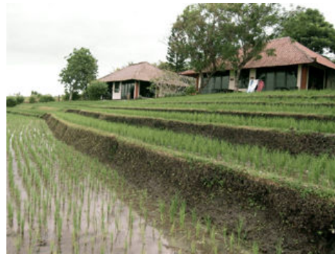
Autres bungalows avec vue sur les rizières et la mer